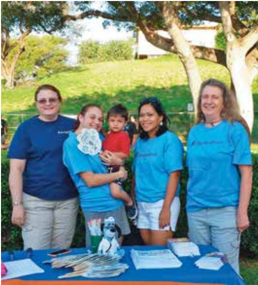
March of Dimes, March for Babies Walk, Kahului