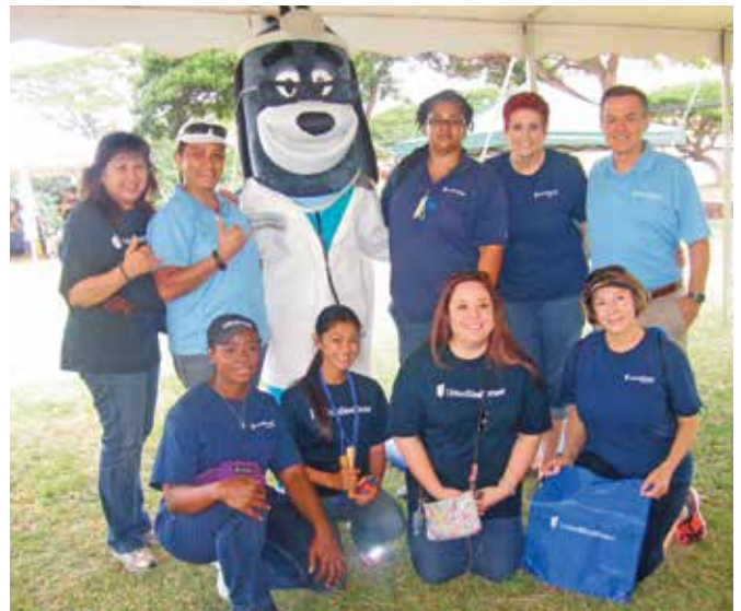
Lễ Hội Mùa Xuân Keiki ở Bờ Biển Wai'anae Thường Niên thứ 9, Wai'anae