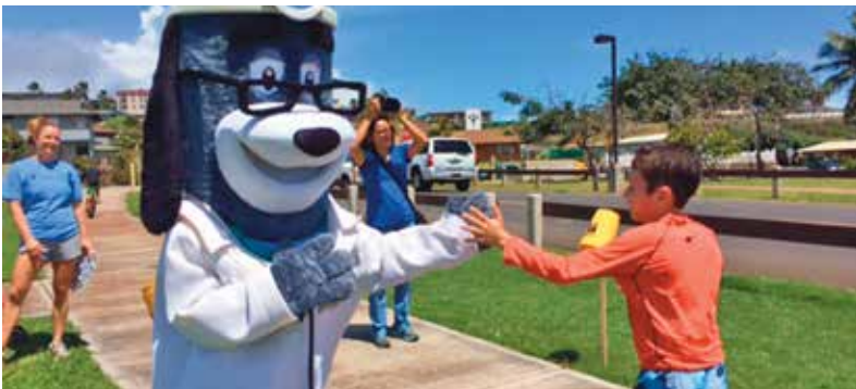
Maui Family YMCA Healthy Kids Day 5K và Fun Run, Kahului