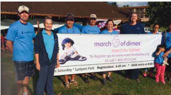
March of Dimes, March for Babies Walk, Kapa'a