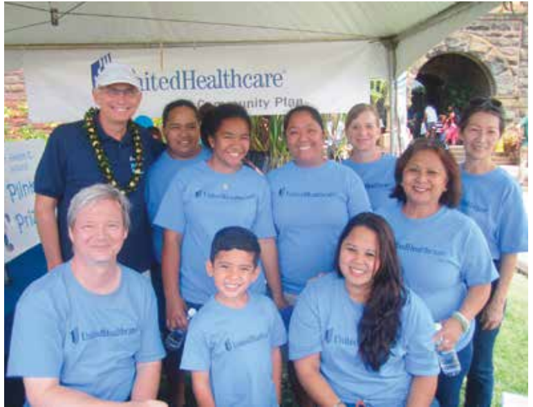
YMCA Healthy Kids Day, Thường Niên thứ 6, Honolulu