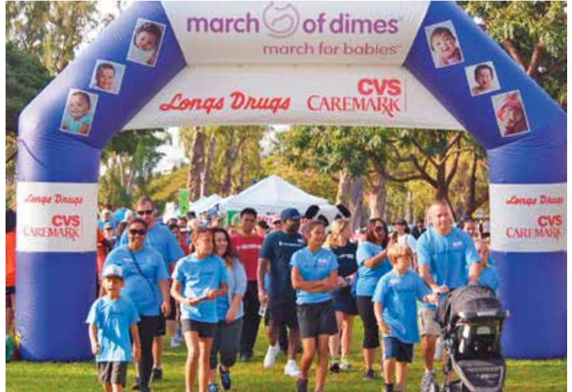
March of Dimes, March for Babies Walk, Honolulu