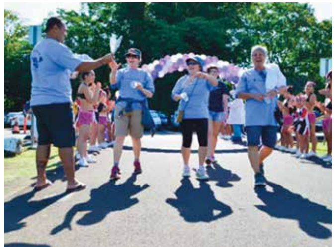
March of Dimes, March for Babies Walk, Hilo