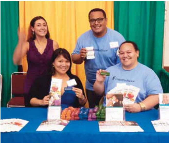
Hội Thảo Bệnh Tiểu Đường TCOYD và Hội Chợ Sức Khỏe, Honolulu