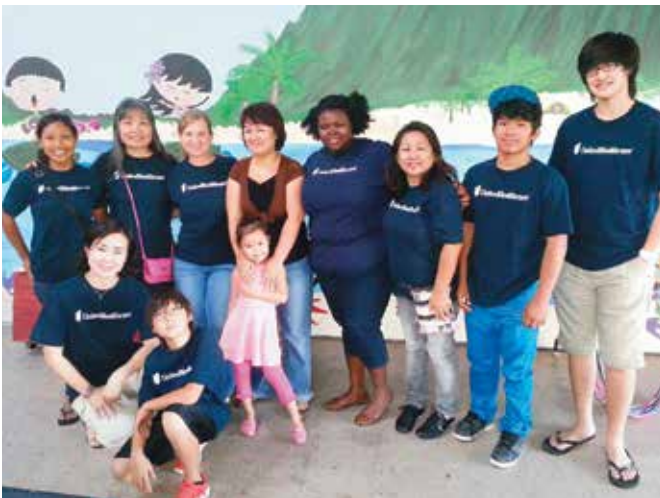
Next Step Shelter February Keki Birthday Party, Honolulu

Chúng tôi cũng tình nguyện trả ơn cộng đồng nơi chúng tôi sống và làm việc. Chúng tôi coi trọng sự gắn bó với từng người mà chúng tôi gặp. Hãy xem một số hoạt động gần đây mà chúng tôi có cơ hội hòa mình với cộng đồng.